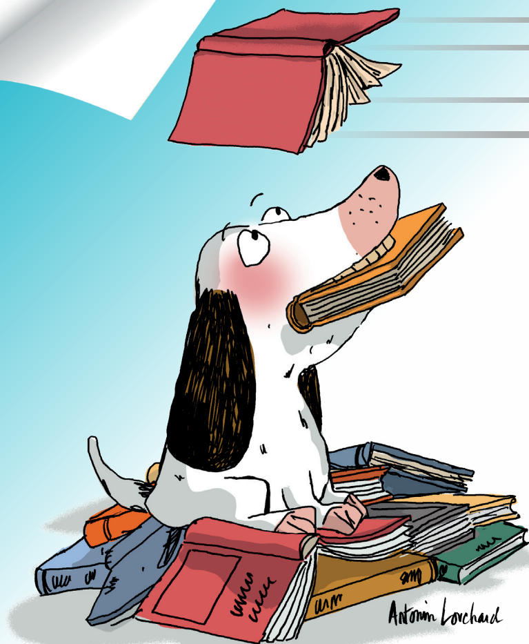
Illustration : Antonin Louchard | Conception graphique : Département de l'Eure.