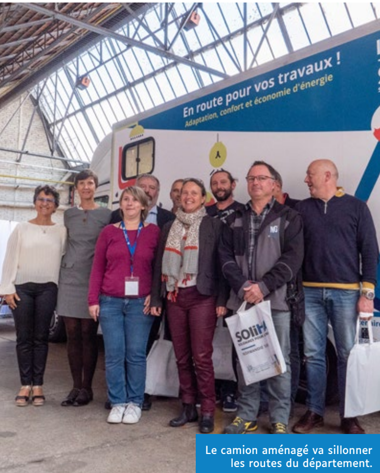
Le camion aménagé va sillonner les routes du département.

C'est un camion aménagé qui permet de visualiser ce qu'il est possible d'adapter dans votre logement lorsque vous vieillissez. Ce truck, véritable « maison itinérante », est une première dans l'Eure.