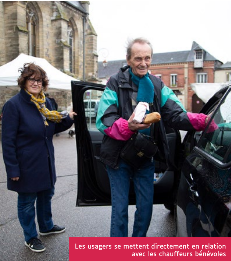
Les usagers se mettent directement en relation avec les chauffeurs bénévoles

Les seniors du secteur d'Étrépagny-Gisors ont de la chance. Grâce aux chauffeurs bénévoles de l'association Trait d'Union, ils peuvent se déplacer sans problème.