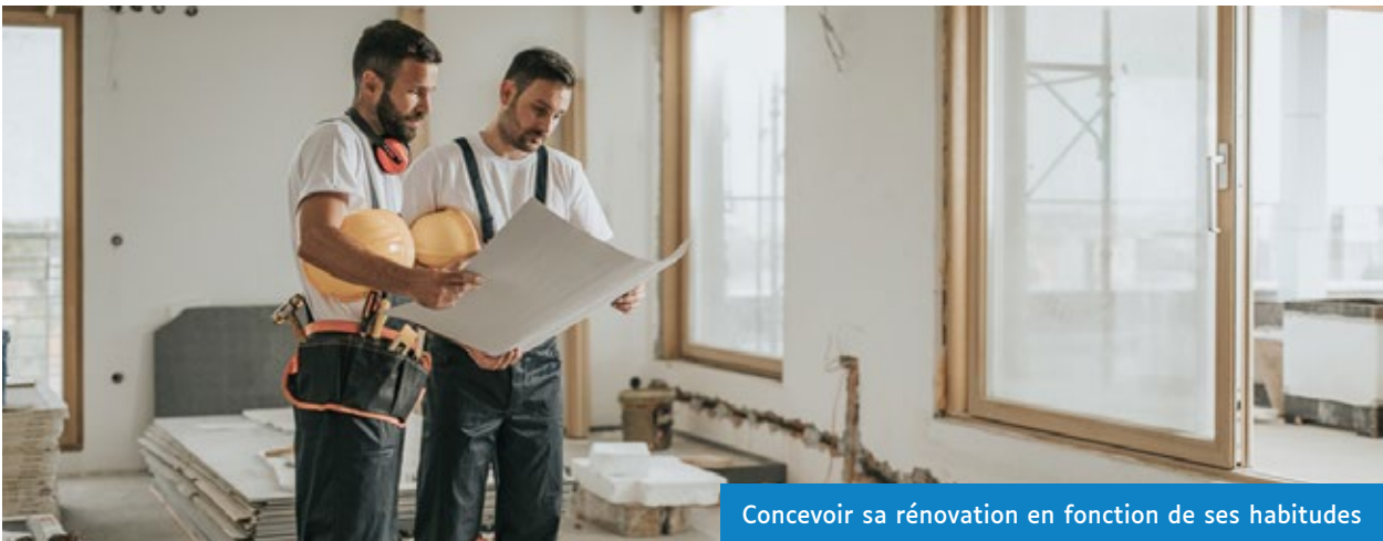
Concevoir sa rénovation en fonction de ses habitudes

Quand on vieillit, il faut repenser son logement en fonction de ses difficultés et de ses habitudes.