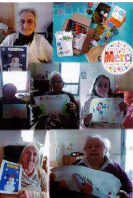
< Les dessins des enfants ont touché les résidents de l'Ehpad de Breteuil.

Dans les Ehpads, le vaccin représente un formidable espoir de retour « à la vie d'avant ». En attendant, il a bien fallu s'adapter pour garder le contact.