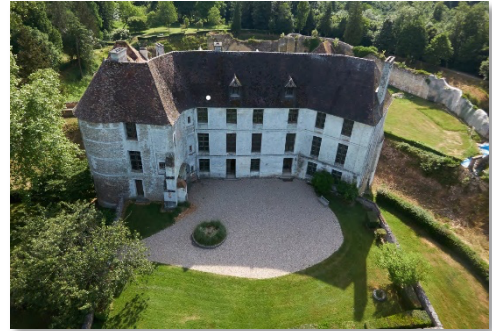
Château d'Harcourt

Le samedi 26 juin, l'Ensemble Zoroastre propose aux passionnés d'opéra, aux amateurs de spectacles comme aux petits et grands curieux de vibrer le temps d'une soirée en plein air, au diapason du chef d'œuvre de Mozart, Les Noces de Figaro . Le public profitera d'un cadre exceptionnel , face à la façade Est du domaine d'Harcourt , un magnifique château médiéval datant des XIIe et XIVe siècles et son célèbre arboretum bicentenaire, situé près de Brionne et Bernay dans l'Eure. L'occasion pour les habitants de découvrir ce site patrimonial en musique, et pour les visiteurs de se programmer un week-end culturel normand !