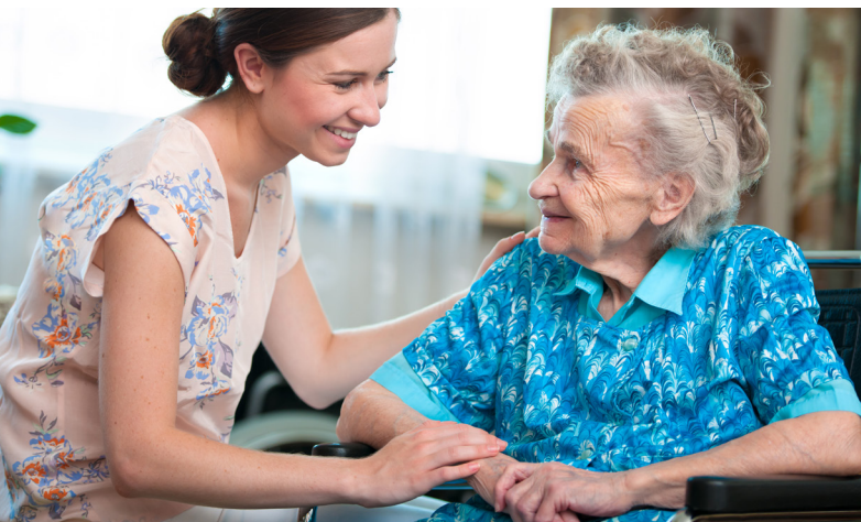
Une journée spéciale autonomie le 29 avril à Bernay.

Dans le cadre des Assises, la journée du vendredi 29 avril à Bernay sera exclusivement consacrée aux seniors et aux personnes handicapées. N'hésitez pas à donner votre avis. Vos idées sont précieuses.