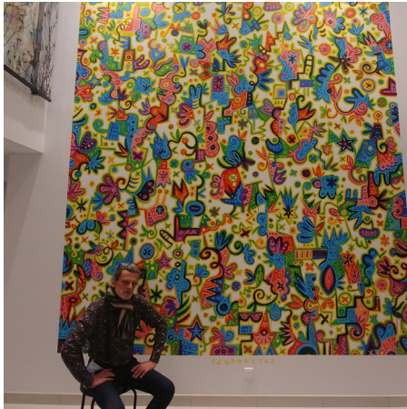
L'œuvre de l'artiste Stéphane Cattaneo illumine le hall de l'extension de l'EHPAD.

L'établissement, inauguré en 2020, a réceptionné en début d'année, la dernière tranche de travaux.