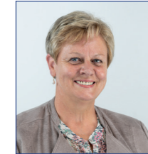
Cécile CARON Conseillère départementale