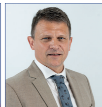
Sébastien LECORNU Vice-président du Département en charge des grands projets et des relations internationales.